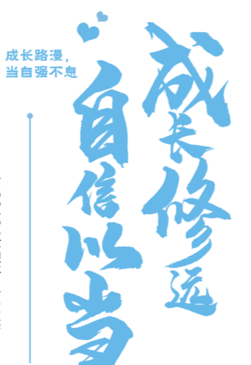
高2018级17班 鲁文然 指导教师 付廷俄

习近平总书记寄语于青年人：“青年人国家的栋梁，是人民的希望。”青年人不仅要自强，更需自信。90后教授自信学间，以学识筑立科学高台；00后护士刘家怡自信行动，以青年人的担当承载疫情中的重担；不满20岁的“大国工匠”夺魁世界大赛，以自信构筑人生的灯塔……无尽的未来，无数的青年，以自信为碑，铭以不灭之理想。从百年前的“少年中国说”，到