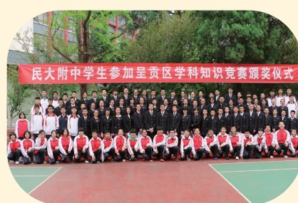
参加呈贡区学科知识竞赛获奖学生