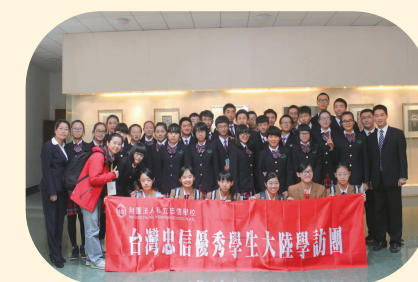
与台湾中信学校共话两岸一家亲