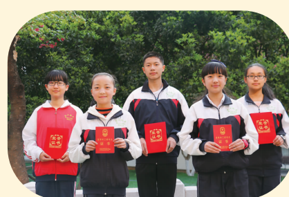
昆明市“三好”“五好”学生