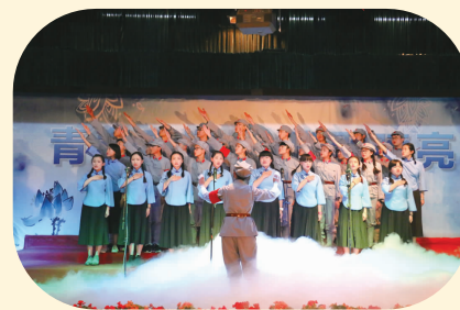
具有革命气息的班歌大赛