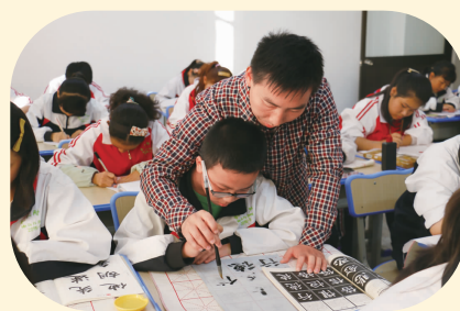
书法课上老师在教学生执笔练字