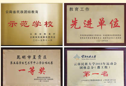
办学两年来学校获奖不断