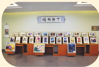
体育艺术节学生作品展示