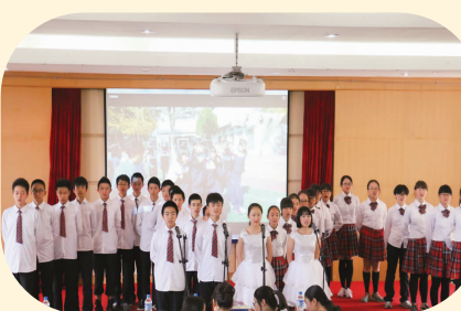
校内“经典诵读”比赛弘扬传统文化