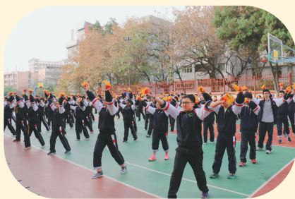
精彩的课外活动烟盒舞