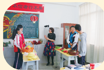
英语口语训练不断超越自我