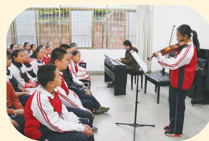
乐器演奏课全面提升艺术素养