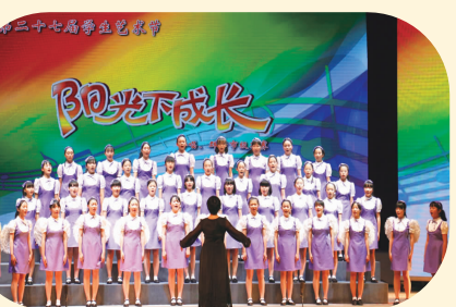
参加昆明市艺术节连续两年获银奖