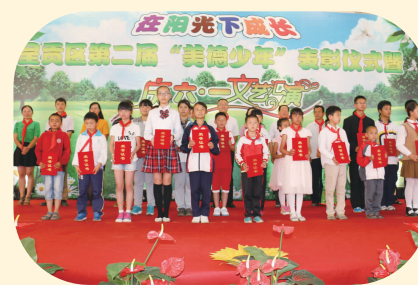
参加呈贡区“美德少年”活动获表彰