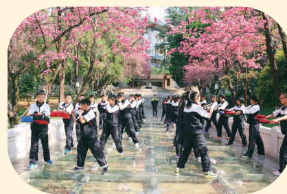
芬芳校园内学生在学习防身术