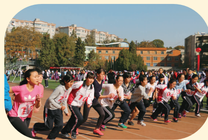
运动会上同学们奋勇争先