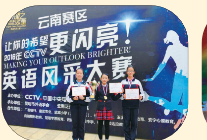
进入 CCTV 英语风采大赛前十名的三名附中学子