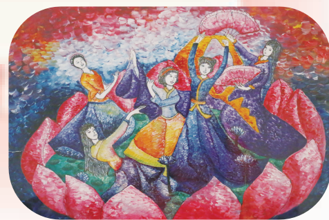
独具匠心 光彩夺目