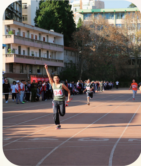
斗志昂扬 永争第一