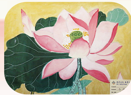
莲花绽放 品质民附