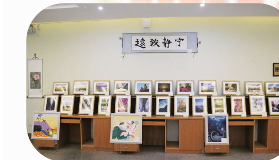
多才多艺 各有春秋