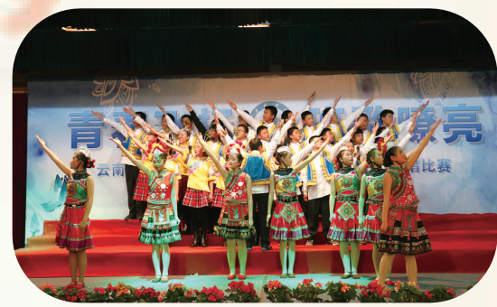
班歌嘹亮 放飞梦想