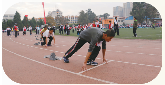
蓄势待发 一往无前