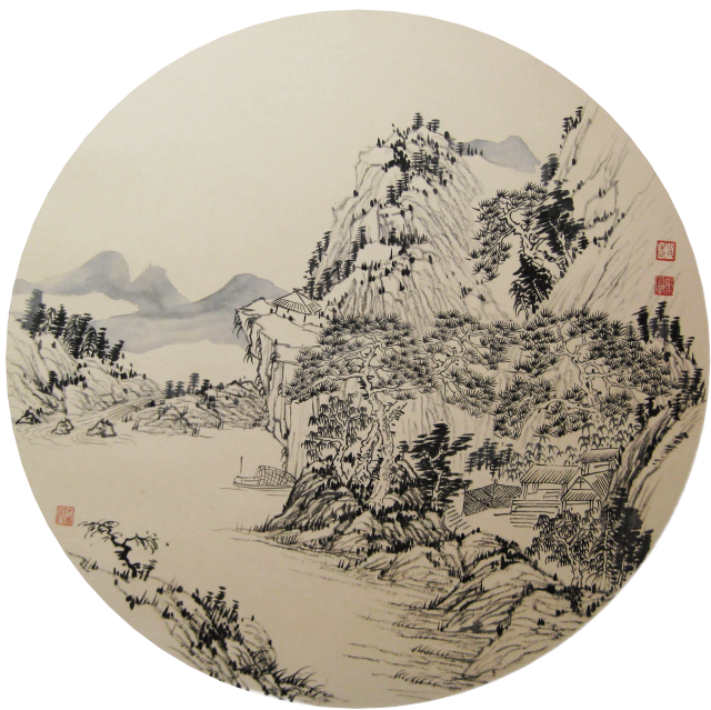
风清气淡 赵勇军 绘