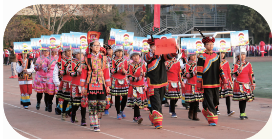
创意方阵 天真浪漫