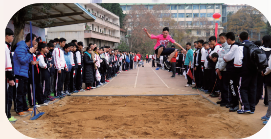
信念坚定 超越自我