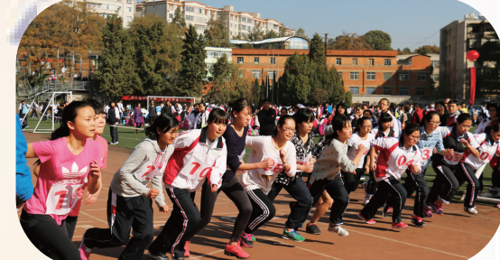
青春少年 朝气蓬勃