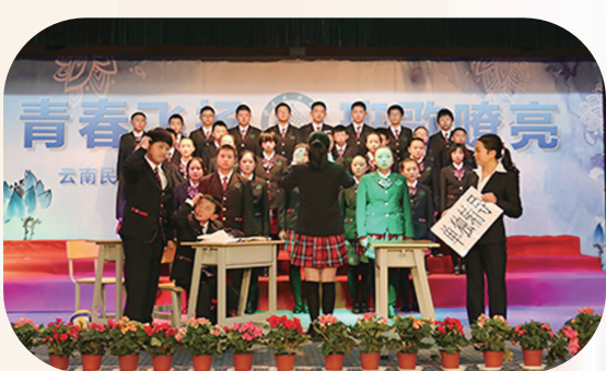
形式多样 凝心聚爱