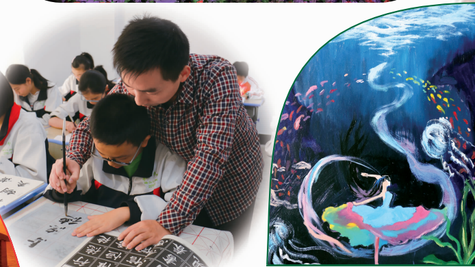
高中部2015级6班 秦芝丹 油画作品《海底芭蕾》