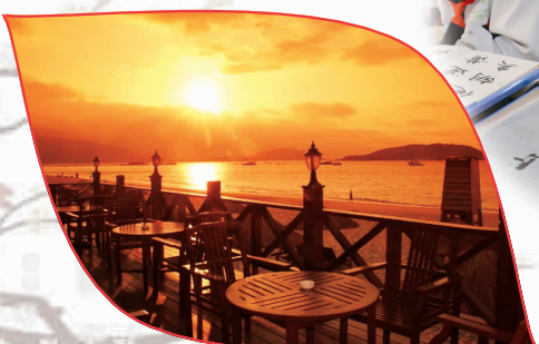
高中部2015级6班 刘昊琳 摄影作品《夕阳》